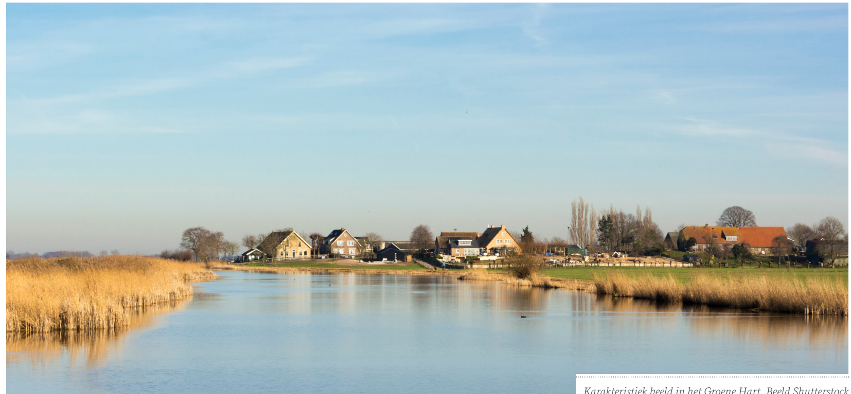
Karakteristiek beeld in het Groene Hart.